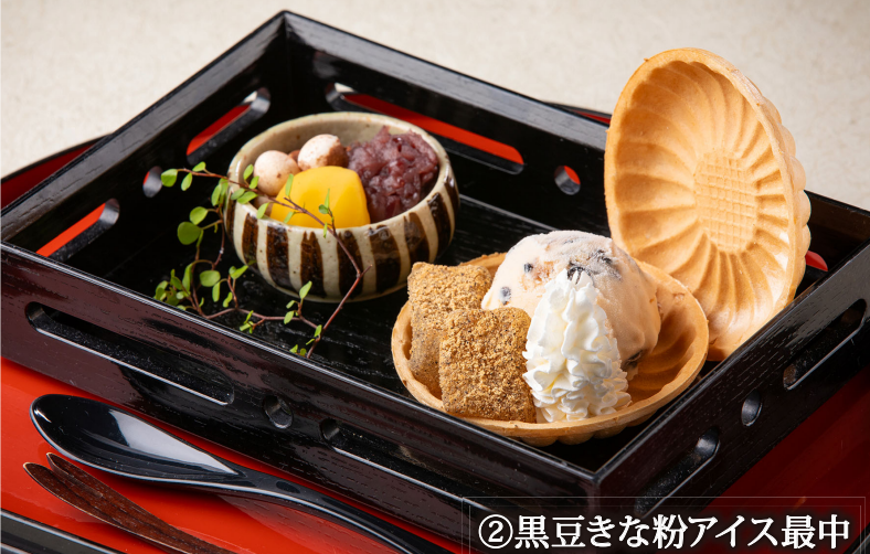
②黒豆きな粉アイス最中