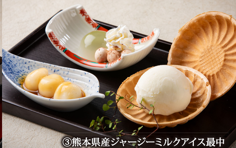
③熊本県産ジャージーミルクアイス最中

薩摩芋・栗などの秋の味覚を、きな粉や和三盆・餡子・みたらしなど和の味わいとともスイーツに仕立てました。最上階からの眺望をご覧いただきながら、午後のティータイムをお楽しみください。