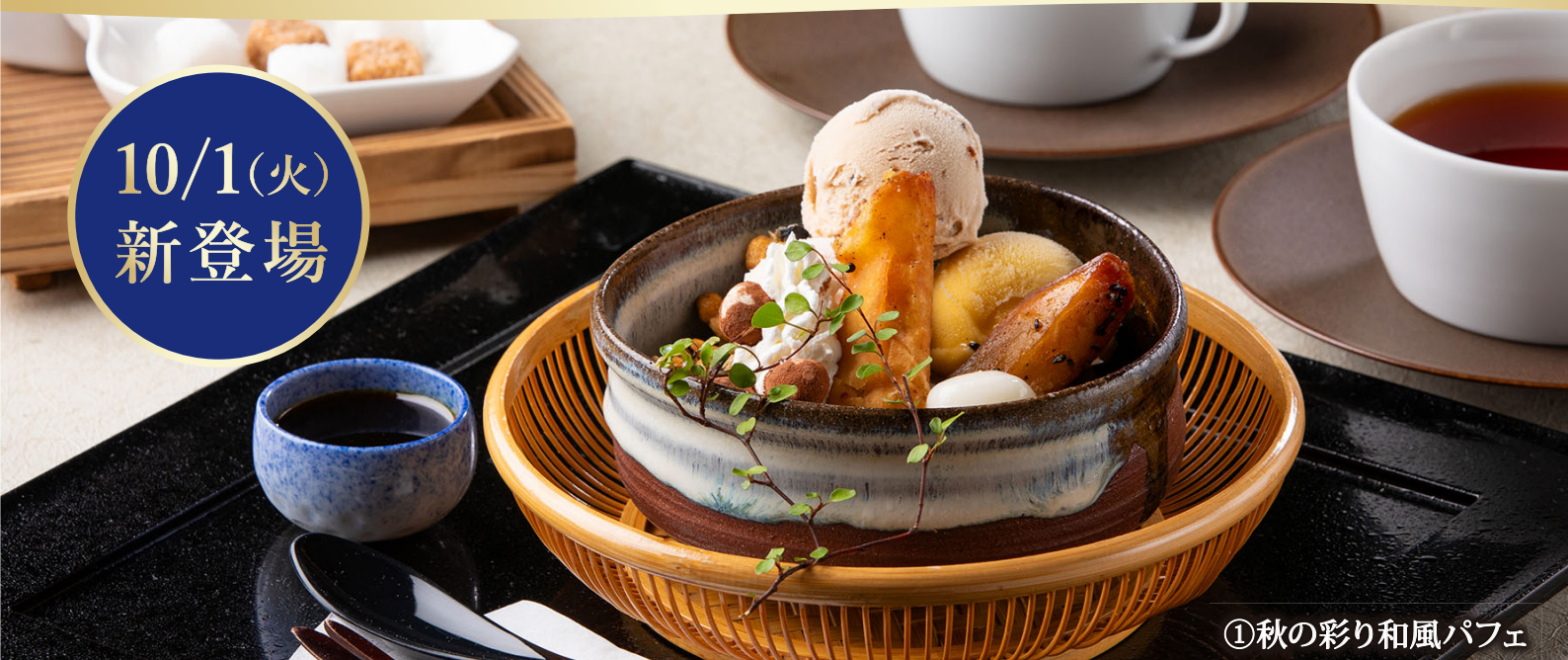
①秋の彩り和風パフェ