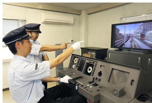
<実際のシミュレーター訓練風景>