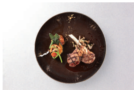
料理一例② (骨付き仔羊のグリル エストラゴン香るソース)