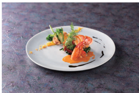
料理一例① (オマール海老のソテー アメリケーヌソース)